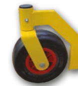
Voorloopwiel Roue jockey

Weergegeven prijs excl. transport & voor België excl. recytyre 1,09€ excl BTW per band/Prix affiché est excl. transport & pour la Belgique excl. recytyre 1,09€ excl TVA par pneu