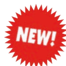
Afschermhek barrières de protection prijs p. 15 / prix p. 15-