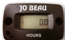
Onderhoudsmeter Compteur d'entretien