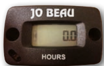
Onderhoudsmeter Compteur d'entretien