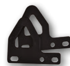
Hefogen-kit Kit anneaux de levage