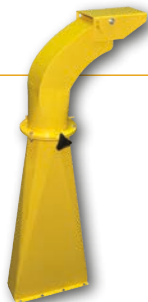
Hoge draaibare buis Goulotte orientable réhaussée