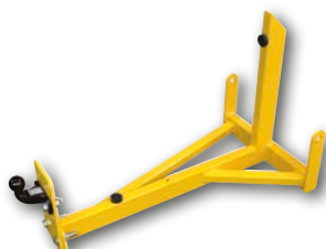
Hef-kit / Kit de levage (T300 & T500)