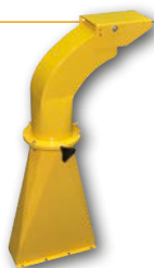
Draaibare buis Goulotte orientable