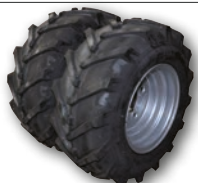
Dubbele wielen Roues jumelées

Weergegeven prijs excl. transport & voor België excl. recytyre 1,09€ excl BTW per band/Prix affiché est excl. transport & pour la Belgique excl. recytyre 1,09€ excl TVA par pneu