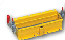
Afneemstuk uitwerp Pièce amovible d'éjection